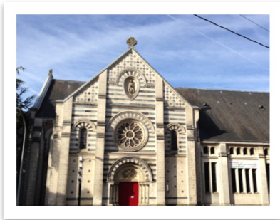
N.D.de Toutes Joies et

La paroisse Saint Jean-Paul II de Nantes, avec ses deux communautés :